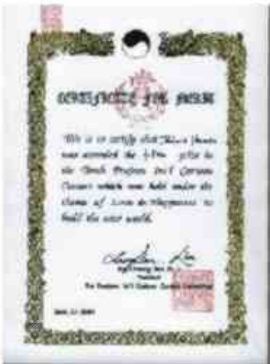
Certificado de premiación, Daejeon Institute, Seoul, Korea (2001)

Ganó el 1er.lugar en el 2do.Certamen Nacional de Comics realizado en Santiago, Chile (2000); por otra parte, obtuvo mención especial por su participación en el Golagha Institute en Teheran, Iran (2001); también recibió Mención Honrosa por su ilustración en el 10° Torneo Internacional de caricaturas realizado en Daejeon, Seoul, Korea (2001)