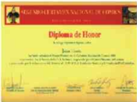
Certificado de premiación, 1° Lugar, Centro Nacional de Comics, Chile (2000)