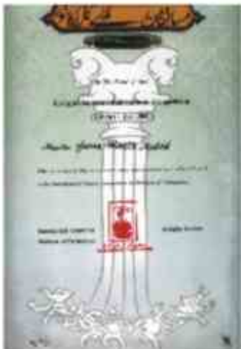
Certificado de premiación, Golagha Institute, Teheran, Iran (2001)